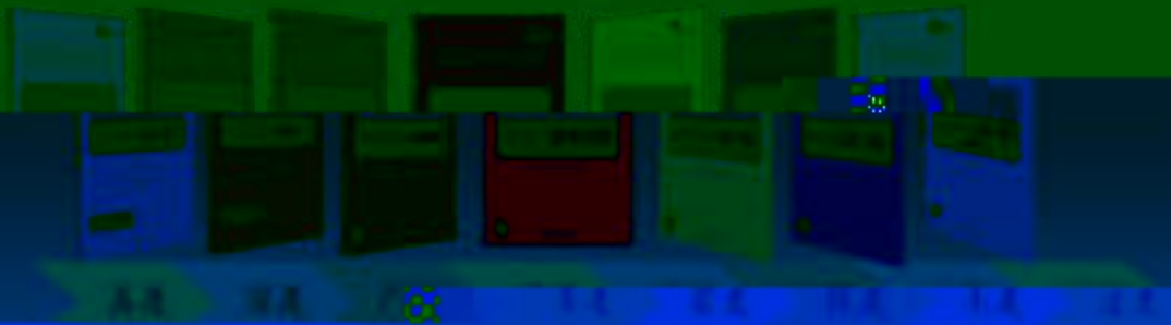
一体化课程教学设计 综合实训基地